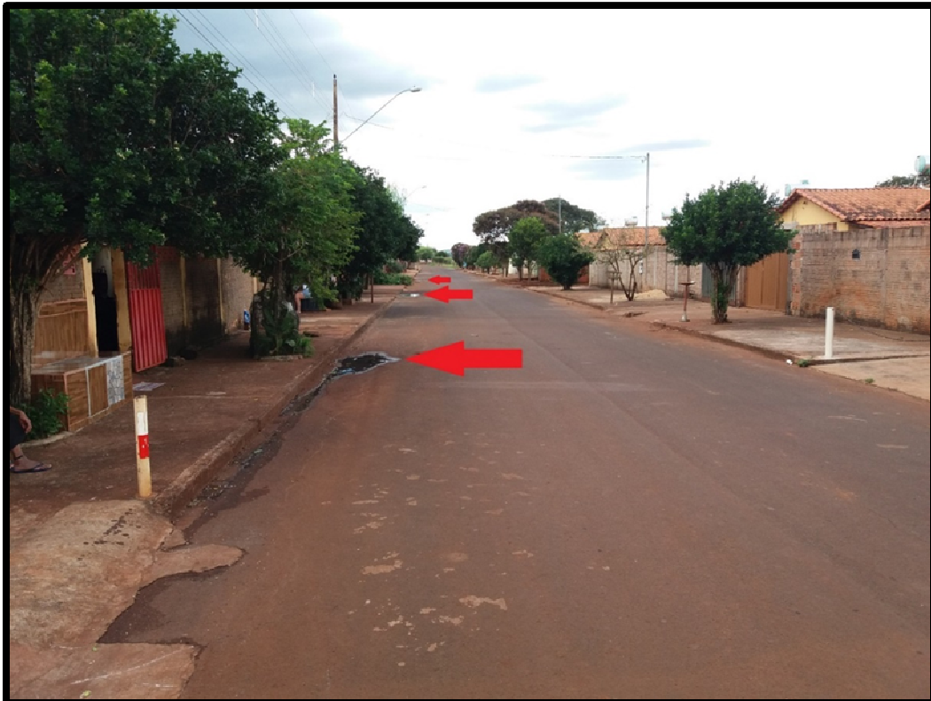
FOTO 1: águas não escoam para dispositivo de drenagem Boca-de-lobo.